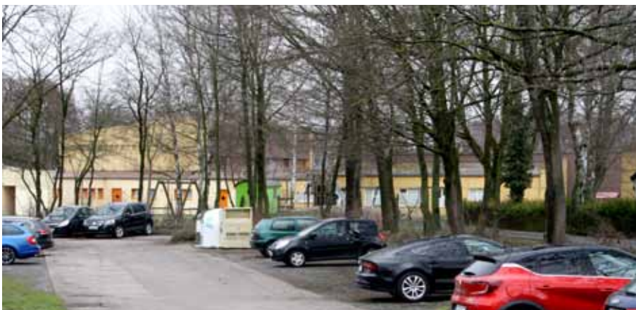
Der Parkplatz an der Wielandstraße/Hebbelstraße könnte die Lösung für die Eltern-Taxis an der Hasselbach-Grundschule sein

Der komplette Abschlussbericht zum gesamten Fußgänger-Check in Detmold wird bis zum Sommer der Verwaltung und Politik vorgelegt werden. Ob und wie die Handlungsempfehlungen realisiert werden, liegt dann im Ermessen der Kommunalpolitik. „Wir werden uns auf jeden Fall für die Umsetzung von sinnvollen Maßnahmen zur Schulwegesicherheit in Pivitsheide einsetzen“, so Kai Kottmann, Ratsherr und Vorsitzender des SPD-Ortvereins Pivitsheide-Nienhagen.