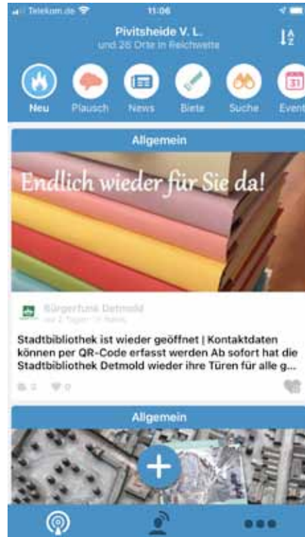
Der Blick in die Dorffunk-App