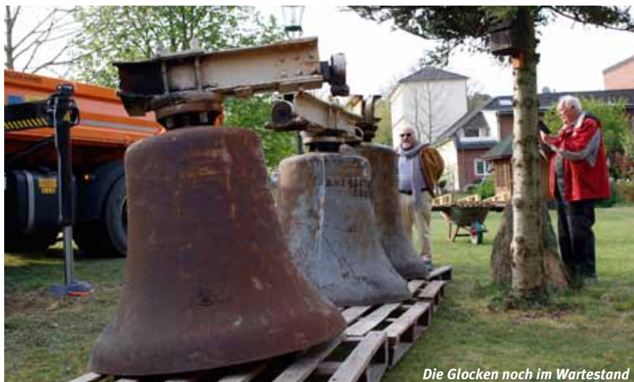
Die Glocken noch im Wartestand