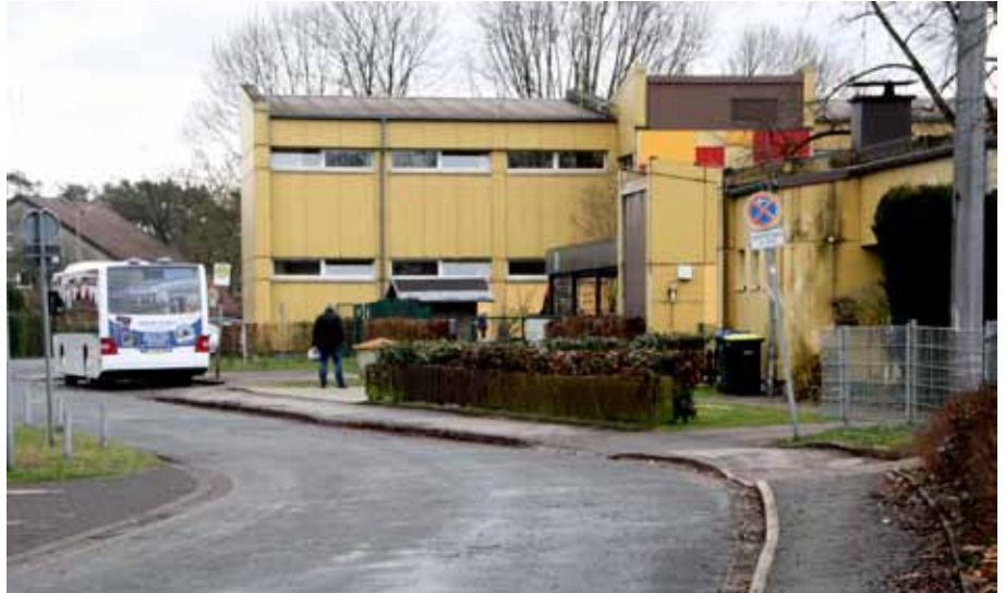
In der Stifterstraße vor der Hasselbach-Grundschule kommt es zu Stoßzeiten immer wieder zu gefährlichen Situationen für die Schüler*innen, die zu Fuß unterwegs sind

Welche Probleme gibt es? Wo kann man barrierefrei und sicher zu Fuß gehen? Wo fehlt Platz? Wo könnte ein Zebrastreifen oder eine Ampel beim Queren einer Straße helfen? Wie kann der Hol- und Bringeverkehr („Elterntaxis“) organisiert und die zu Fuß gehenden Schüler*innen dabei Fußgänger*innen geschützt werden? Genau unter die Lupe genommen wurden dabei die Ampel-Überquerung an der Bielefelder Straße auf der Höhe der Oil-Tankstelle und die Situation der Fußwege rund um die Hasselbach-Grundschule. Im Mittelpunkt des Interesses stand hier die grundsätzliche Schulwegesicherheit und die „Elterntaxis“ vor und nach dem Unterricht. Unter Teilnahme der Pivitsheider Ortsbürgermeister, Ratsmitglieder und interessierter Bürger*innen wurden die potentiellen Gefahrenstellen diskutiert und Ideen für Lösungsmöglichkeiten entwickelt. Begleitet werden die verschiedenen Etappen des Fußverkehrs-Checks von einem Planungsbüro, das den Prozess nicht nur moderiert, sondern vor allem dokumen-